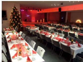
Premiere-, Vereins- und Weihnachtsfeier