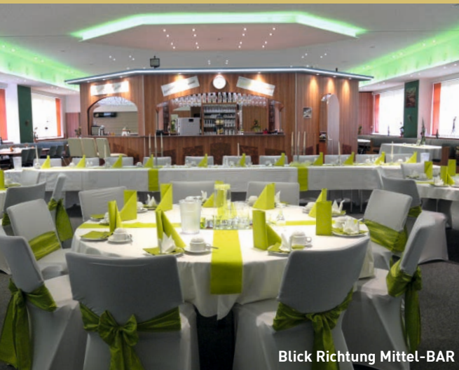
Blick Richtung Mittel-BAR