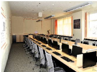
EDV-Schulung (versenkbare Monitore)