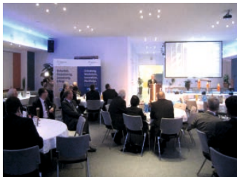
Schulung, Konferenz, Kundenevent