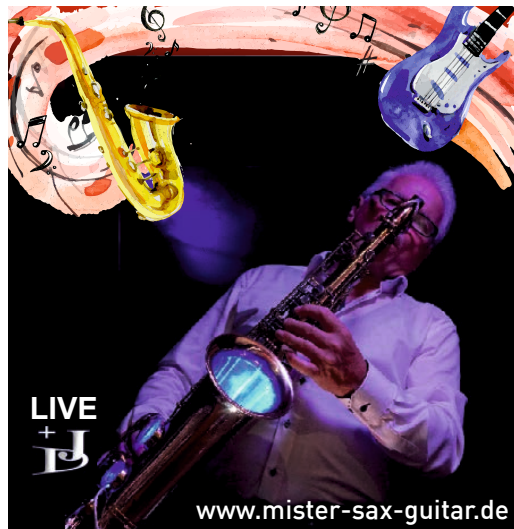
Mr. Sax & Guitar

info@mister-sax-guitar.de | Tel. 0170 / 121 0184.